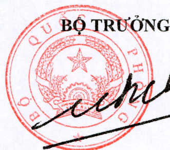
Đại tướng Ngô Xuân Lịch